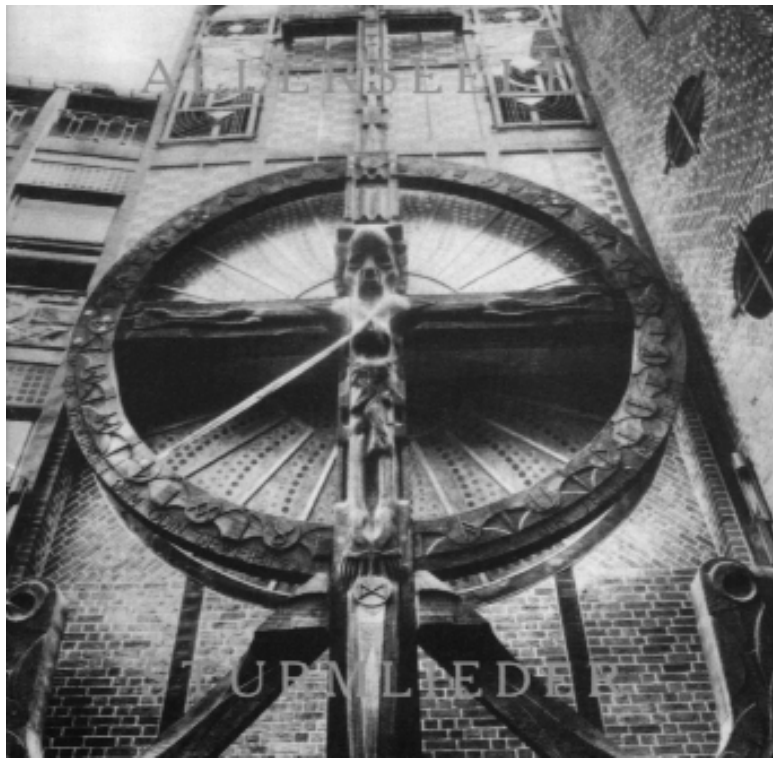
Cover der Allerseelen-CD „Sturmlieder“ (1997) mit der Wotanskulptur von Bernhard Hoetger vor dem „Haus Atlantis“ in der Bremer Böttcherstraße

"Gerade die Kunst soll nach ihrem Willen [dem Willen der Vordenker der Neuen Rechten] nicht länger Diskurse anregen, soll nicht nach Rasonnement verlangen. Nicht kritische Distanz oder die Fähigkeit differenziert zu denken wird gefordert, sondern die Inthronisierung des gesunden Menschenverstandes.