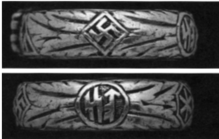
Der Totenkopfring der SS mit „Runen-Sinnsprüchen“

nicht führen. (...) Verfaßt doch Streitschriften, schreibt Lieder, gründet Gruppen, Zeitschriften.“ (Kadmon, „Anti-Faschismus: Katholizismus ohne Gott“, 1997)