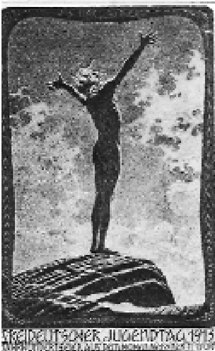
Das Lichtgebet von Fidus (1891)

Leben und Werk des Malers Fidus, alias Hugo Höpener, eine der Ikonen des Jugendstils und der Wandervogelbewegung der Jahrhundertwende,